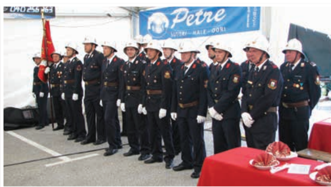
Častni vod GZ Lenart

domu obnovili fasado, menjali vsa tri garažna vrata in postorili še veliko drugega.