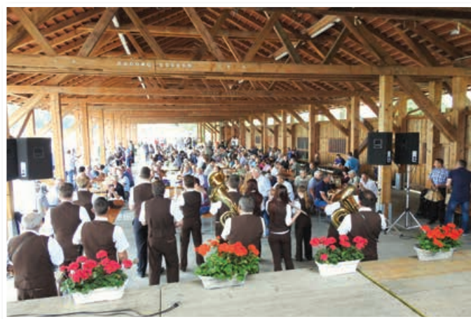
Pogled na dogajanje na prireditvenem prostoru ŠRC Polena v času proslave

skozi 60 let. Posebej se je zahvalil predhodnim in današnji generaciji ribičev za neutrudno delo pri varstvu voda, življa v njih ter ohranjanju naravnih danosti okolja, v katerem delujejo. Prizadevanja ribičev žal niso vedno naletela na posluš in zato se danes marsikje soočamo s slabim stanjem vodotokov, predvsem reke Pesnice, ki je bila nekoč neprimerno bogatejša z ribami kot danes, ko je potrebno za ohranitev kolikor toliko sprejemljivega staleža rib te redno vlagati. Izpostavil je dobro sodelovanje z občinama Lenart in Sveta Trojica.