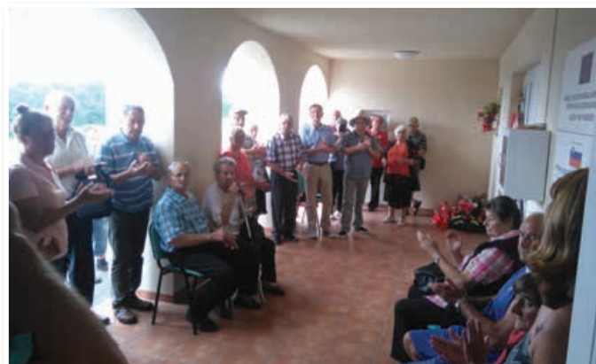
Slovesnost v spomin na tragično usodo družine Druzovič.