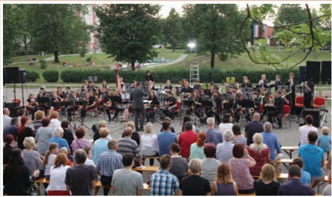
Koncert Big banda in Revijskega orkestra Konservatorija za glasbo in balet Maribor s solisti. Mestni park dr. Jožeta Pučnika v Lenartu, sredo, 21. junij 2017.