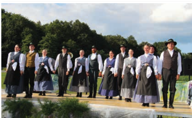
Nastop folklornih skupin