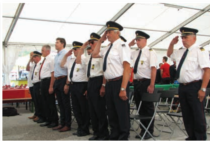
Gostje benediške gasilske jubilejne slovesnosti

Praznovanje v Benediktu je potekalo tudi v znamenju 46. Dneva gasilcev Gasilske zveze Lenart. Zato je gasilce