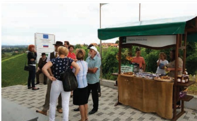
60-letnica Čebelarstva društva sv. Ana