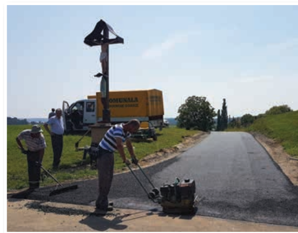
Asfaltiranje ceste v Sp. Gasteraju

Kljub poletnim počitnicam in vročinskimi valovom, ki so udrhali po Sloveniji, dela na Gasterajski cesti niso počivala. Delavci podjetja Komunala Slovenske gorice so v tem mesecu z asfaltiranjem krožišča v Sp. Gasteraju opravili z večjimi deli na tej cesti. V teh dneh sledi še ureditev prometne signalizacije in urejanje priključkov ob cestišču. Sočasno s to rekonstrukcijo je juravska občina asfaltirala še makadamski odsek v dolžini cca 300 m v Sp. Gasteraju.